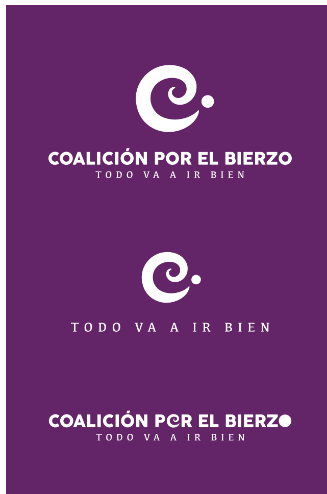
Fondo de color no corporativo oscuro