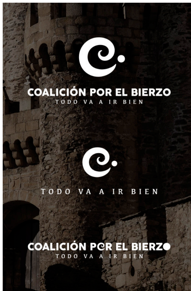
Fondo fotográfico oscuro